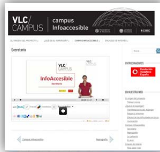
Il·lustració 1. Pantalla d'exemple de l'eina polimèdia

Com es desprèn de la il·lustració anterior, el material elaborat s'ha adaptat a la imatge de VLC/CAMPUS i tingut en compte la imatge corporativa de les entitats promotores d'aquesta actuació, incorporant a més els elements que defineixen la imatge gràfica del projecte i els continguts i consells que s'imparteixen sobre els resultats obtinguts en l'estudi previ ja realitzat i l'enquesta que s'ha realitzat al personal universitari.